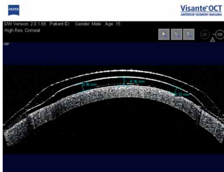
Рис. 2 Снимки ОКТ пациента с кератоконусом третьей стадии, перенесший кросслинкинг коллагена роговицы. Гибридная контактная линза Clear Kone на поверхности роговицы в правильном положении.

Функциональные показатели, а именно, ухудшение остроты зрения и усиление рефракционных данных роговицы, через 1 год после ношения линз ClearKone показали прогрессирование кератоконуса на 14 глазах (8 пациентов): острота зрения - 0,23 \pm 0,11 (от 0,1 до 0,6); рефракция роговицы – в среднем 53,12 \pm 3,61 Д. (от 48,77 до 57,65 Д.); топографический астигматизм - в среднем -5,63 \pm 4,02 Д.; сферозэквивалент рефракции глаза в среднем -8,62 \pm 3,61 Д (от -3,50 до -11,50 Д.).